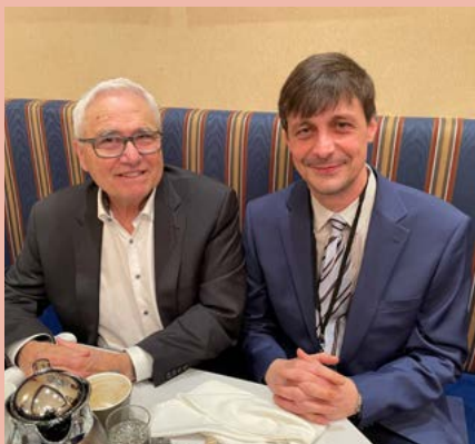
Le 23 février 2023, le président de l'ACFA, Pierre Asselin, rencontrait le Commissaire aux langues officielles, Raymond Thériège, afin de discuter des attentes de l'ACFA concernant le projet de loi C-13 et le prochain PALO, à Ottawa.