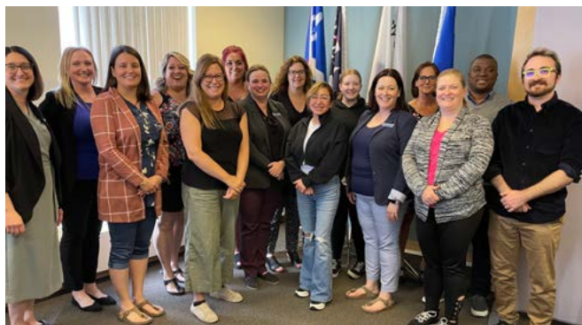
Les rencontres mensuelles du Franco-Réso se sont poursuivies l'année dernière. Les directions régionales des ACFA ont eu l'occasion de mettre à jour leurs connaissances sur différents dossiers et d'échanger avec des leaders de la communauté francophone