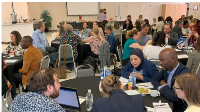
C'est sous le thème Horizon Frab : Osons imaginer la francophonie de demain , l'édition 2023 du Forum communautaire s'est déroulée le 27 mai 2023, rassemblant plus de 110 participant.e.s provenant d'une soixantaine d'organismes, d'institutions et de communautés culturelles de la francophonie albertaine