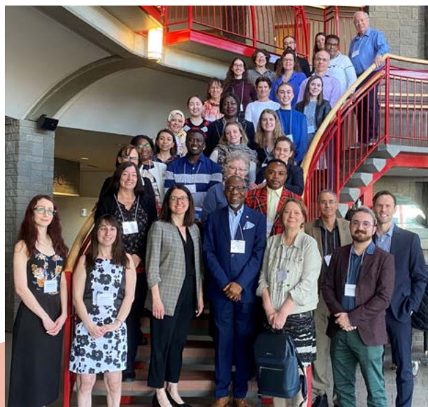
L'intérêt était marqué lors du Forum sur les services sociaux et la santé mentale en français, tenu le 18 avril 2023 à Edmonton. Plus d'une trentaine de participant.e.s de diverses régions étaient présents pour l'occasion.

AAfin d'adresser cette complexe problématique et d'établir un état des lieux du secteur, l'ACFA, appuyée par la firme KPMG, a tenu huit consultations regroupant des leaders d'organismes communautaires ainsi que des professionnel.le.s de la santé. Des sondages ont été distribués à la population générale et aux pourvoyeurs de services et un forum de validation, ayant rassemblé une trentaine de participant.e.s, a eu lieu le 18 avril 2023 à Edmonton. L'ACFA a réussi à sécuriser le financement de ses trois partenaires financiers, soient la Calgary Foundation, la Edmonton Community Foundation ainsi que la Fondation franco-albertaine, pour la deuxième année du projet qui permettra notamment de partager l'information recueillie, en plus de mettre sur pied un comité de travail communautaire visant à doter le secteur d'une vision, d'un plan stratégique à long terme et de stratégies d'implémentation.